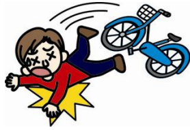
自転車で転んでのケガ