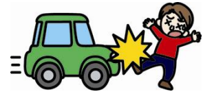
自動車にはねられてのケガ