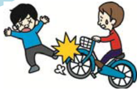
自転車で通行人にけがをさせた