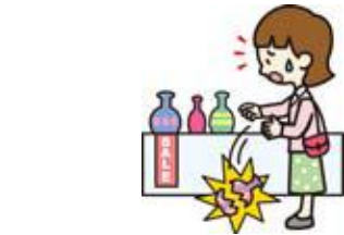
買い物中過って商品を壊した