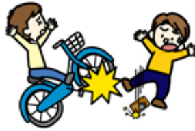
自転車にはねられてのケガ